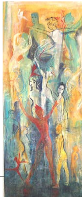
»eMotion« Acryl auf Leinen