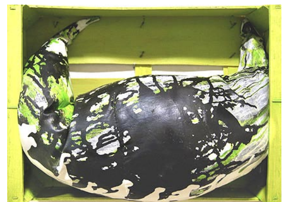
aus der Reihe »Treibhäuser, hier und anderswo« Keimling, bemalt, in Gemüsestiege

„Meine Werke leben von der Spannung zwischen Material und Malerei, zwischen Fläche, Struktur und Linie. Ich finde es spannend, Geschichten zu erzählen, zu erklären, aber auch zu verwirren.“