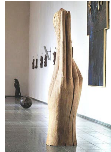
»Hand mit Vogel« Holz