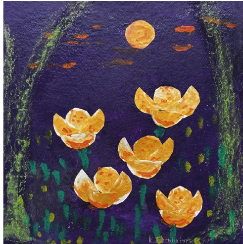
Karin Flörsheim »Mondblumen im Märchenwald« Acryl auf Papier