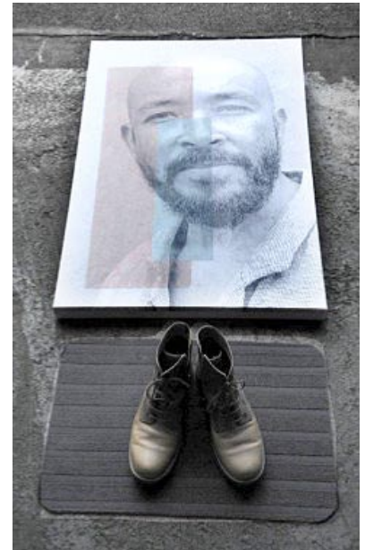
„Füße abtreten nicht vergessen“