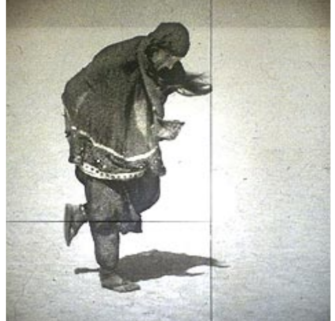
»Process / Progress« Multimedia-Ausstellung Kunst-Keller Krefeld, Leyentalstr. 28 47799 Krefeld 13.4. - 13.5. 2018