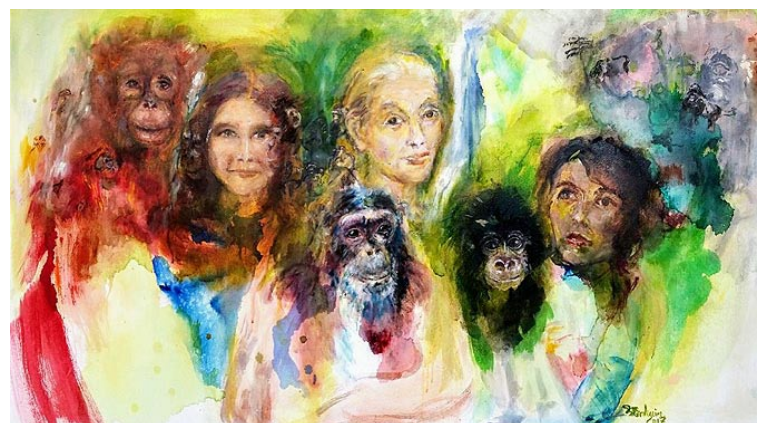
„Trimates“: Jane Goodall, Dian Fossey Birutė Galdikas mit Schützlingen

Als junge Frauen wurden Jane Goodall, Dian Fossey und Biruté Galdikas als „Trimates“ oder „Leakey's Angels“ bekannt. Sie wurden von dem berühmten (Paläo)Anthropologen Louis Leakey beauftragt, drei der vier Menschenaffen-Arten zu studieren: Schimpansen, Gorillas und Orang-Utans. Nach Jahrzehnten der Forschung veränderten diese Frauen unser Wissen über die Menschheit und über die verstandesmäßigen und emotiona-