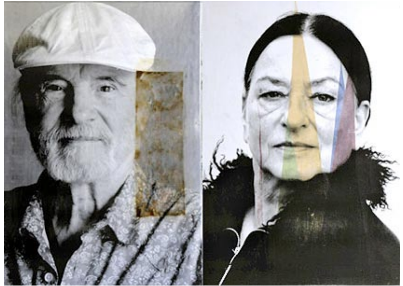
Hanne Horn: „Hans und Helga“ Digitale S/W-Fotografie / Collage

Ausstellung »MUSS Kunst« Öffnungszeiten: Landtag NRW, Düsseldorf Mo-Fr 9.00-17.00 Uhr Platz des Landtags 1 Sa / So 11.00-17.00 Uhr 9.4.-19.4.2016