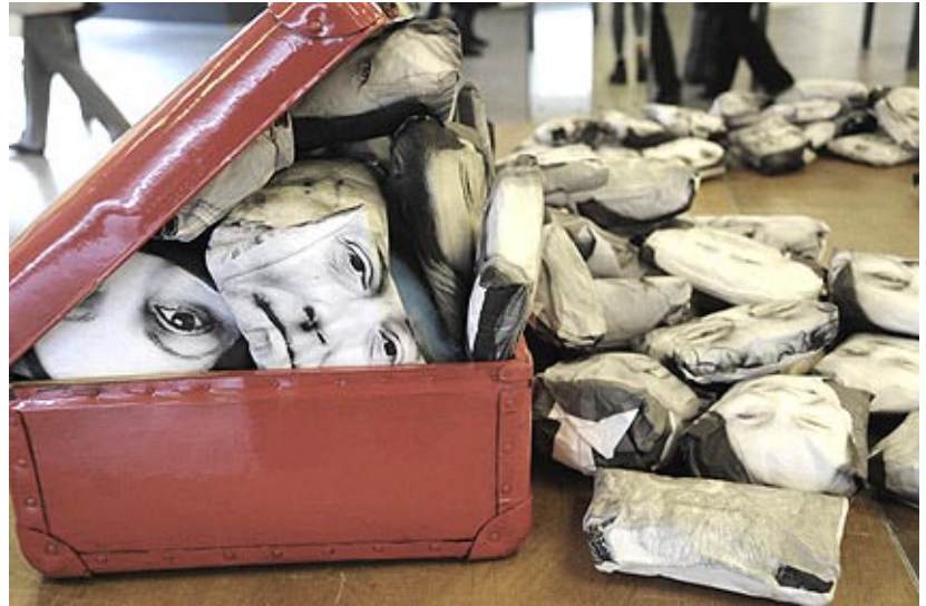
»KÜNSTLER ENTDECKEN EUROPA« 6. Europäischer Künstlerwettbewerb der Europa-Union Leverkusen Galerie und Foyer im Forum Leverkusen 51373 Leverkusen 6.3.-20.3.2016